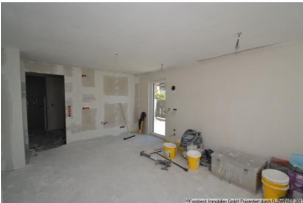
Küche mit Gartenzugang