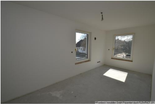
Kinderzimmer 2 OG