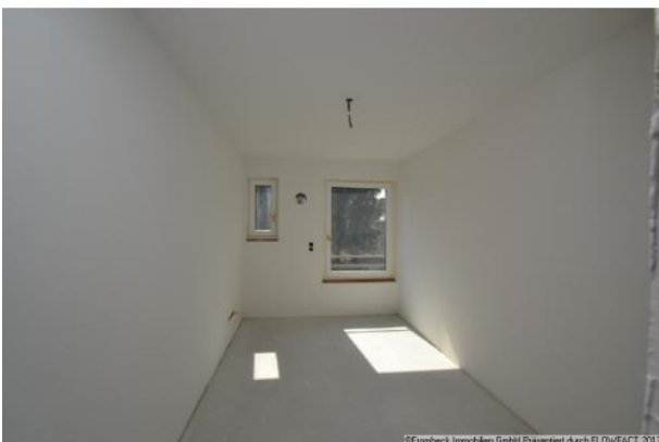
Kinderzimmer 1 OG